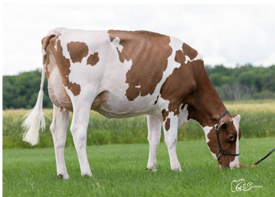
MICHERET SAUGE ZOOM RED DAUGHTER